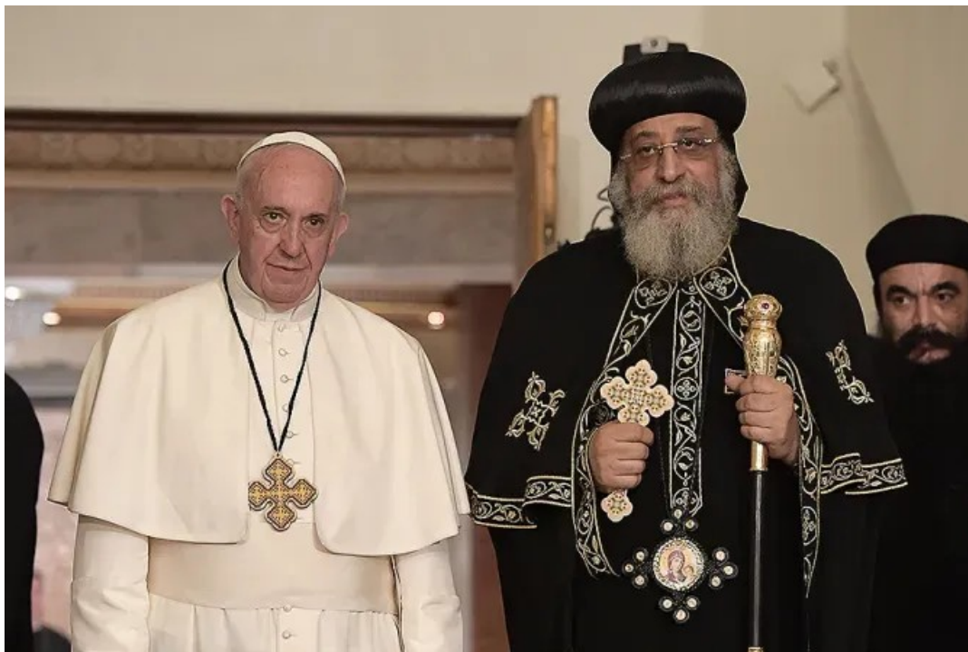
Le pape François avec Tawadros II, patriarche copte orthodoxe d'Alexandrie, au Caire, en Égypte, le 28 avril 2017.

3- La même volonté a été affirmée par des responsables d'Églises chrétiennes orientales, dont le patriarche copte orthodoxe Tawadros II. Les chrétiens coptes sont nombreux en Égypte et dans les communautés de l'immigration en Occident.