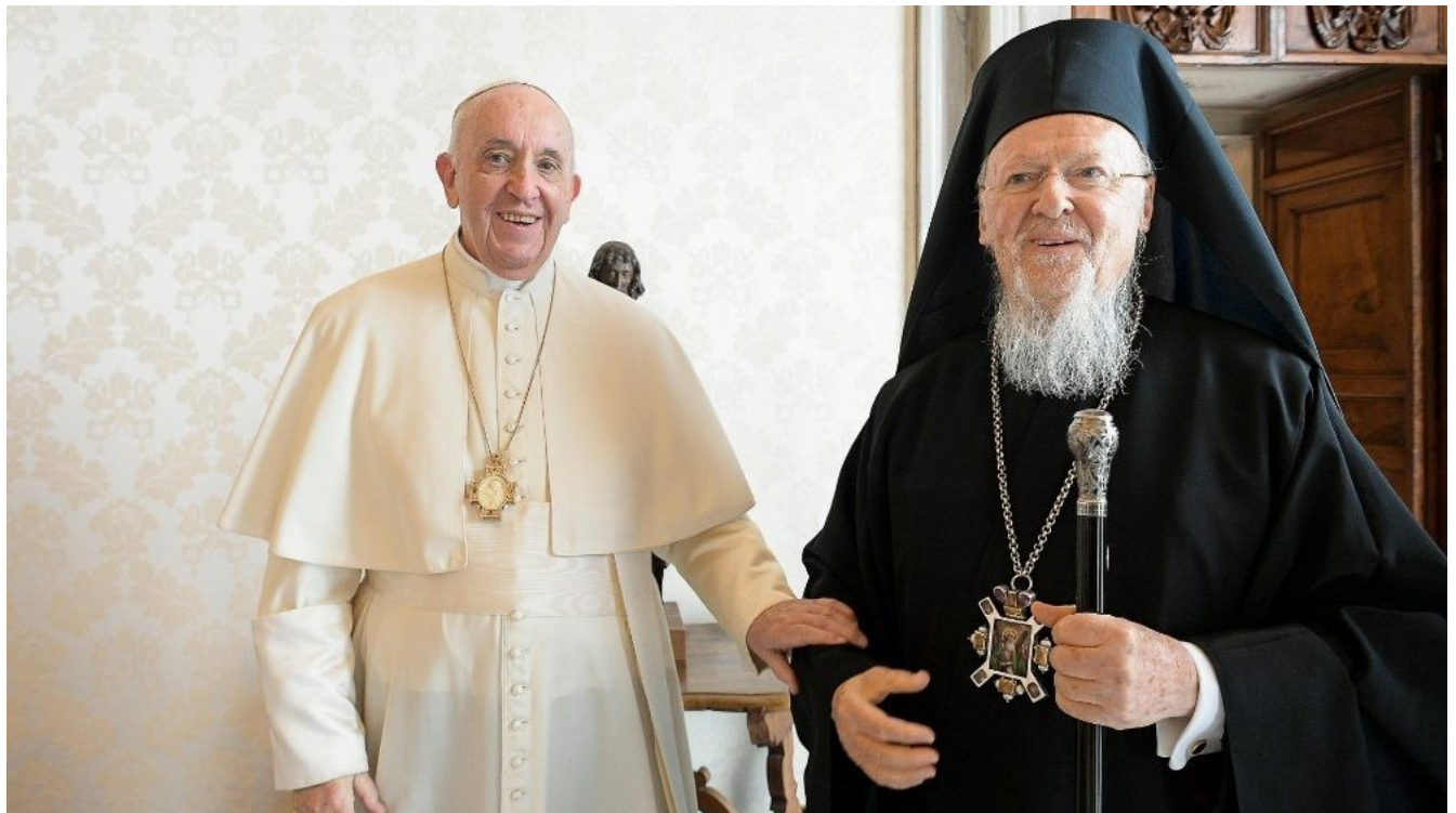
Le pape François et le Patriarche Bartholémée 1 er (Vatican 2021)

Le patriarche avait invité en 2024 le Souverain pontife à se rendre à Nicée pour les commémorations des 1 700 ans du Concile œcuménique qui est commun à toutes les églises chrétiennes.