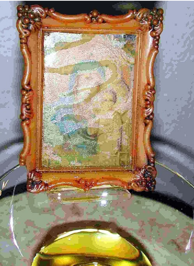
L'icône qui suinte de l'huile

En 2025, la fête du concile oecuménique de Nicée (qui a eu lieu il y a 1700 ans en Turquie) donne un souffle nouveau au Message de Soufanieh