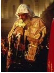
الجزيرة الوثائقية تعرض فيلما عن البابا شنودة